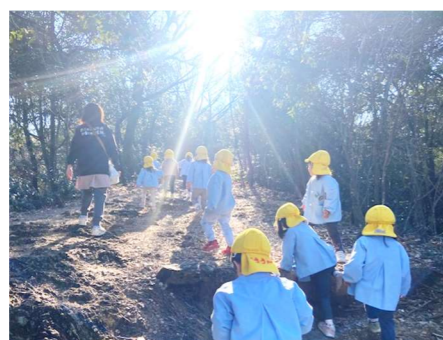
もうすぐ安桜山展望台！