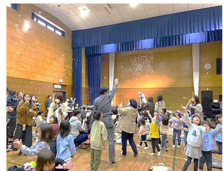
しゃぼん玉ショー