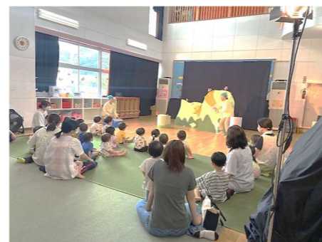
0, 1, 2歳児さん、人形劇を見ました★

さくら組が夏野菜(なす・ピーマン・枝豆)を育てています。朝と夕方、当番が水やりをし、大きくなったら収穫、給食の味噌汁やサラダに入れてもらい、他のクラスにも食べてもらいます。先日、収穫したピーマンを使い、さくら組がピザ作りをしました。トースターで焼ける様子を見たり、においを嗅いだり、「早く食べたい!」と待ちきれない様子!焼きあがり、パクリ!「おいしい!」苦いピーマンも美味しい!これが食育ですね 🍷 主任