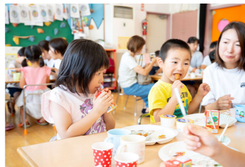
きな粉パーティー